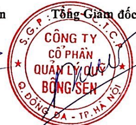
Cao Hoài Thanh

(Các thuyết minh từ trang 12 đến trang 32 là bộ phận hợp thành của Báo cáo tài chính này).