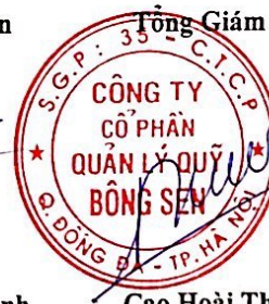
Cao Hoài Thanh

(Các thuyết minh từ trang 12 đến trang 32 là bộ phận hợp thành của Báo cáo tài chính này).