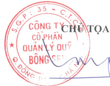
Phương Thành Long